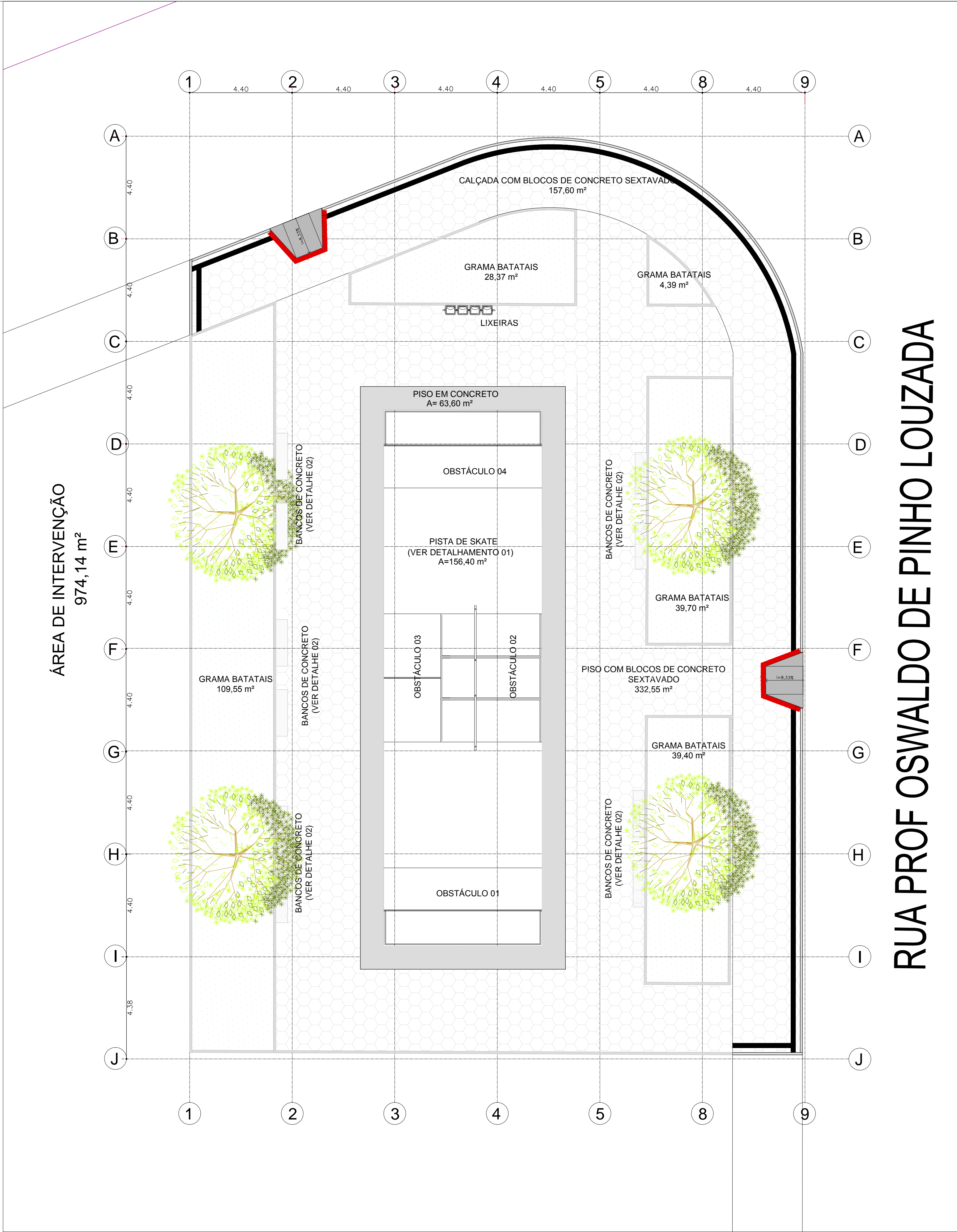
01 PAISAGISMO ESC: 1:100